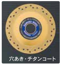
穴あき・チタンコート