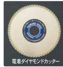
電着ダイヤモンドカッター