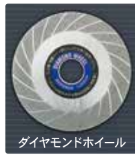
ダイヤモンドホイール