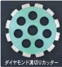
ダイヤモンド溝切りカッター