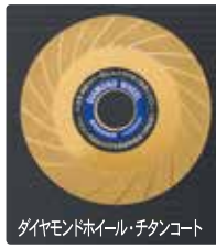
ダイヤモンドホイール・チタンコート